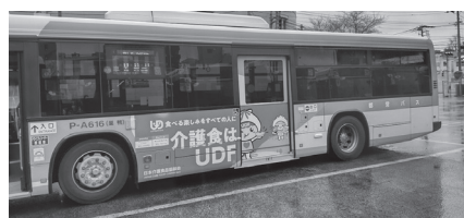
「かいごちゃん」「ささえちゃん」を使用した都営バスラッピング