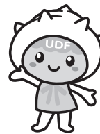
オリジナルキャラクター 「かいごちゃん」(左)と「ささえちゃん」(右)