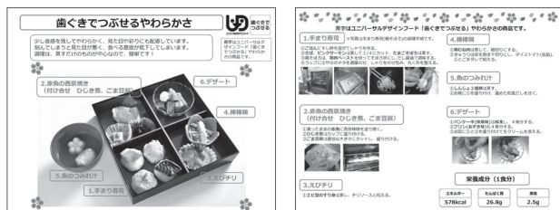
「歯ぐきでつぶせる」の活用例