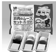
3食セット お肉のムースセットA