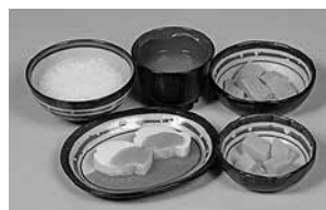
夕食用盛り付け例