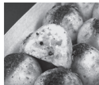
刻んだ蛸入りたこ焼