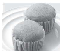
米粉入り蒸しケーキ (むらさき芋)